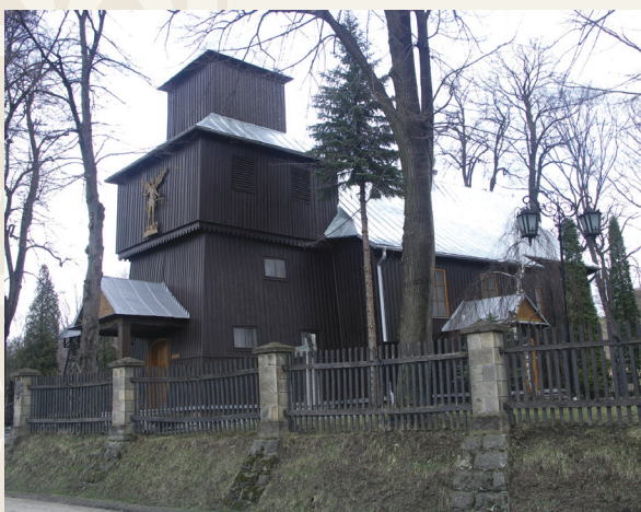
Kościół Matki Bożej Nieustającej Pomocy w Złotej

Złota jest niezwykle malowniczą wsią, położoną na skraju Pogórza Wiśnickiego. Miejscowość ma charakter pagórkowaty i jest schowana pomiędzy mniejsze oraz większe wzniesienia. Przyciągała ona osadników już w epoce neolitycznej. Od IX lub X w. na jej teren zaczęli przybywać tu Słowianie. Wieś została prawdopodobnie lokowana na prawie niemieckim w połowie XIII w., na co wskazuje fakt, że już w 1346 r. istnieje tu parafia. Pierwotnie miejscowość nazywała się Złotnica i w poł. XIV w. znajdowała się w wykazie świętopietrza na rzecz Stolicy Apostolskiej. W 1384 r. należała do Jaśka ze Słota, później Verneka de Bylesko, Klemensa Thurskiego z Gnojnika. Wtedy też nazwa wsi wielokrotnie się zmieniała na: