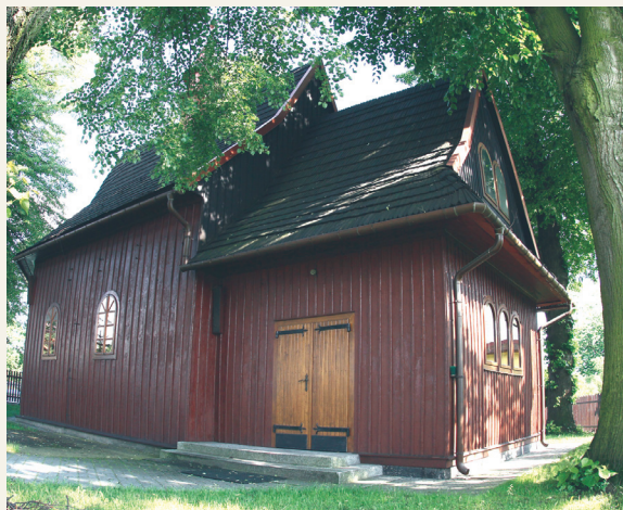
Kościół Przemienienia Pańskiego w Jurkowie