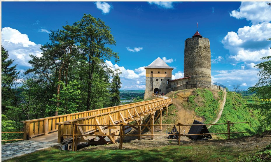
Zamek w Czchowie, militarna ścieżka edukacyjna