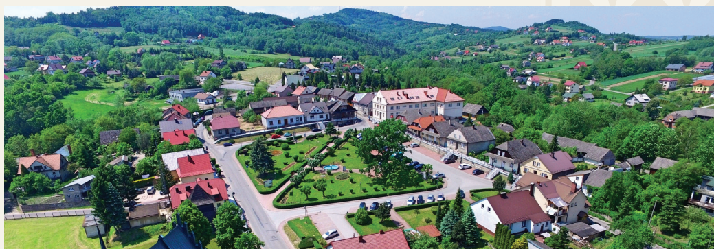
Widok z „lotu ptaka” na centrum Czchowa

Gmina Czchów jest gminą miejsko-wiejską, leżącą w południowej części województwa małopolskiego, w powiecie brzeskim, na granicy z powiatem tarnowskim i nowosądeckim. Sąsiaduje od południa z gminami Gródek nad Dunajcem i Łososina Dolna, od wschodu z gminą Zakliczyn, z jej południowej strony z gminami Dębno i Gnojnik, a od zachodu z gminami Iwkowa i Lipnica Murowana.