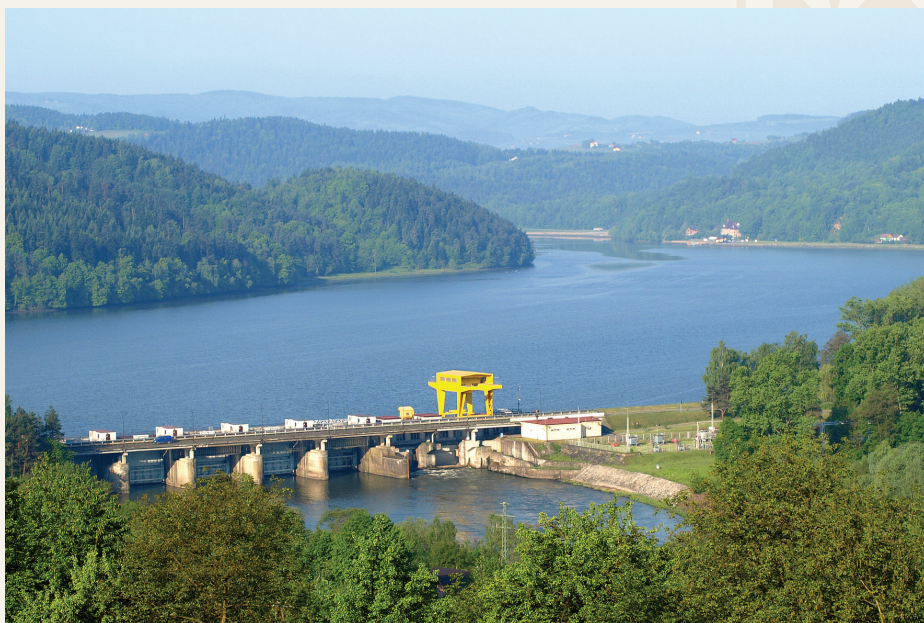
Zapora wodna z elektrownią na Dunajcu

niąca okoliczne miejscowości od powodzi oraz produkuje prąd, to również jest drogą łączącą Czchów z miejscowością Piaski-Drużków (należącą do gminy Czchów i jedyną leżącą po prawej stronie Dunajca). Warto podkreślić, że Piaski-Drużków jest świetną propozycją dla ludzi aktywnych, zwłaszcza rowerzystów i spacerowiczów. Rowerzysta korzystający ze ścieżek Velo Dunajec będzie zachwycony jadąc od Piaski-Drużkowa w kierunku Zakliczyna i dalej Tarnowa, a spacerowicze i grzybiarze mają do dyspozycji spore tereny leśne, obfitujące w owoce lasu. Na jeziorze działa przystań wodna ulokowana tuż przy Zaporze Wodnej. Czynna jest w okresie letnim i należy do pobliskiego kompleksu noclegowo-gastronomicznego „Łaziska”. Oferuje zarówno bierny wypoczynek w blasku słońca, jak również atrakcje wodne takie jak: rejs gondolą lub wypożyczanie sprzętu wodnego. Jest tutaj miejsce na kampery i biwakowanie. Otwarcie przystani jest uzależnione od warunków pogodowych, dlatego warto skontaktować z opiekunami obiektu. Przeprawa promowa po Jeziorze Czchowskim to wyjątkowa atrakcja, ponieważ taki środek transportu wodnego w obecnych czasach jest rzadko spotykany. Na terenie gminy Czchów działają dwa promy, jeden z nich na rzece Dunajec, który łączy Czchów z miejscowością