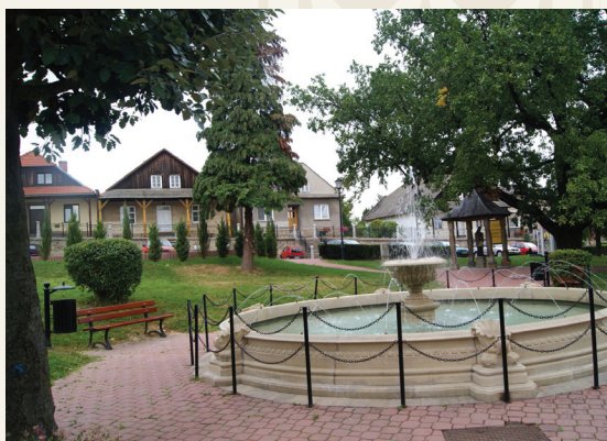
Fontanna w Czchowie