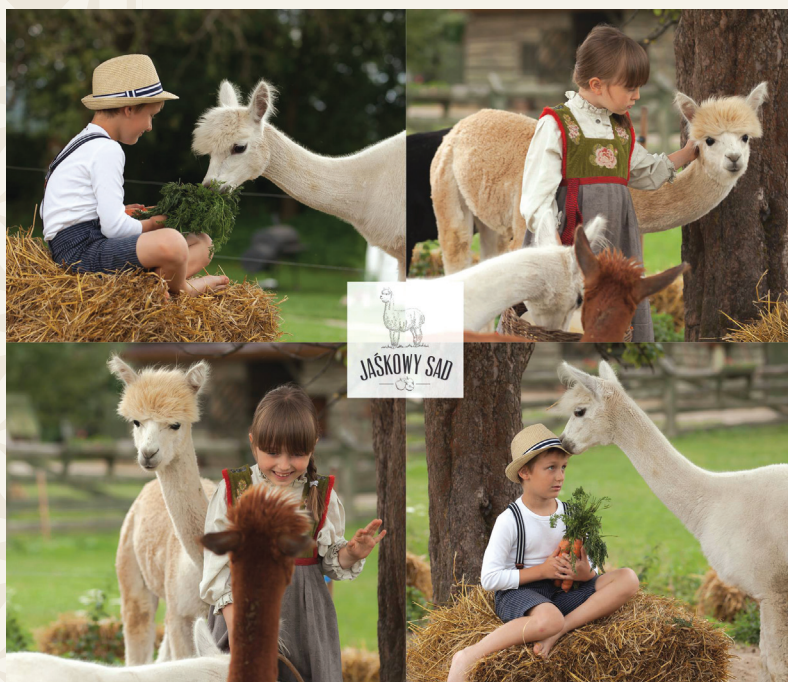
Alpaki w Jaśkowym Sadzie

Jaśkowy Sad jest prywatną posiadłością, której właściciele chętnie goszczą w swoich progach turystów z najdalszych zakątków. Mają w ofercie punkt gastronomiczny z własnymi, lokalnymi wypiekami oraz napojami, a także z miejscem na wyjątkowy odpoczynek i wyciszenie na łonie natury. Centralnym miejscem Jaśkowego Sadu jest teren przeznaczony dla hodowanych tam alpaki. Zwierzątka te są bardzo pozytywnie odbierane przez turystów, którzy chętnie zapisują się na ich karmienie, głaskanie i wspólne przebywanie. Jaśkowy Sad jest dostępny w okresie letnim.