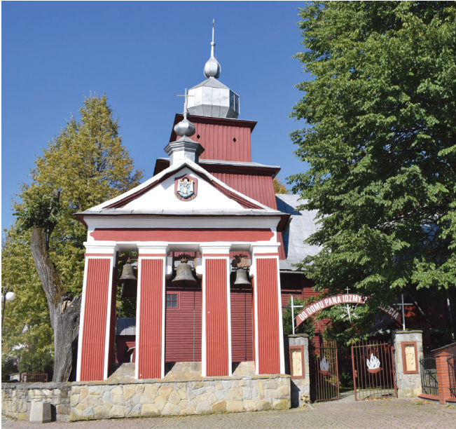
Kościół parafialny Świętych Apostołów Piotra i Pawła w Tyliczu.

miejskie miało (jakoż przywilej zasadzenia baczymy y tego dochodzimy) a za czasem na wieś obrócone; obywatele zaś jego od wiary ś. Rzymskiego katolickiego kościoła odstąpiwszy, greckie obieli nabożeństwo – tedy pozwalamy, aby obywatele domostwa swoje między gruntami – miasto fundamentami starych murów obwiedzone zbudowali 21 .