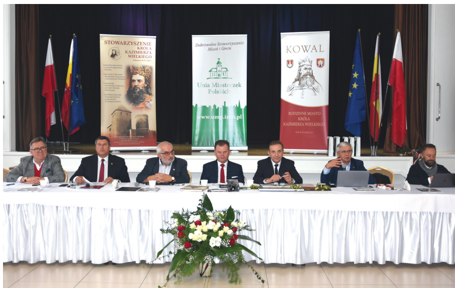
Prezydium obrad ogólnopolskich organizacji samorządowych.