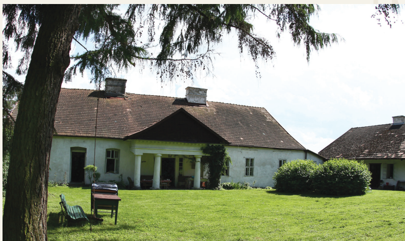
Dwór w Biskupicach Melsztyńskich