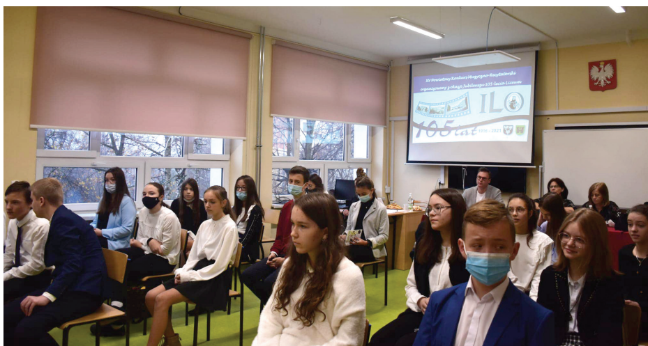
Uczestnicy części recytatorskiej XV Powiatowego Konkursu Muzyczno-Recytatorskiego

XV Powiatowy Konkurs Muzyczno-Recytatorski zorganizowany z okazji Jubileuszu 105-lecia I Liceum Ogólnokształcącego im. Króla Kazimierza Wielkiego w Olkusz oraz 100. rocznicy nadania Szkole imienia odbył się 19 listopada 2021r. r. Jego edycja została przeprowadzona w tradycyjnej formie, dzięki czemu uczestnicy – uczniowie szkół podstawowych i ponadpodstawowych – mogli zaprezentować swoje zdolności i emocje bezpośrednio przed jurorami i publicznością.