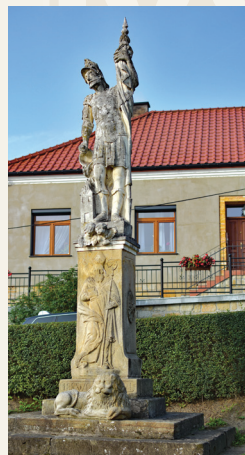
Kamienna figura św. Floriana