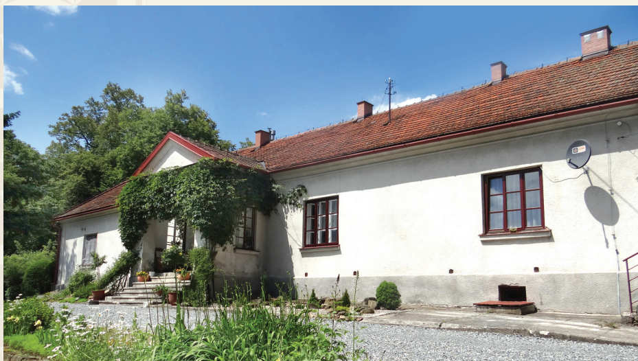
Dwór w Tymowej

Tymowa jest największą terytorialnie miejscowością gminy Czchów. Wieś ma górzisty charakter z trzema charakterystycznymi wzniesieniami: Gosprzydowską Górą, Machulcem i Szpilówką. Pomiędzy Machulcem i Szpilówką przebiega zielony szlak turystyczny, którym można udać się przez Iwkową do Rajbrotu oraz dojechać z Tymowej do Lipnicy Murowanej i Wieliczki.