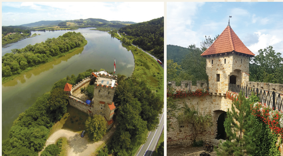
Zamek w Tropsztynie

Zamek Tropsztyn w Wytrzyzszcze otwiera podwoje dla turystów w lipcu i sierpniu. Dla wszystkich zwiedzających jest przygotowany, to w pełni odrestaurowany zamek z miejscem widokowym na szczycie. Wewnątrz można zwiedzić zmieniającą się raz do roku wystawę artystyczną, także zapoznać się z historią tego zabytku podczas seansu filmowego. Ponadto miejscowi przewodnicy chętnie opowiadają o licznych ciekawostkach związanych z tym miejscem, zwłaszcza o legendzie wiążącej zamek z ze skarbami Inków. Wkoło zamku prowadzi ścieżka ze stromymi schodkami, którymi można dojść nad taflę Jeziora Czchowskiego.