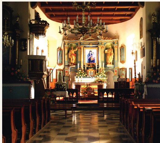
Kościół i ołtarz główny kościoła w Domosławicach