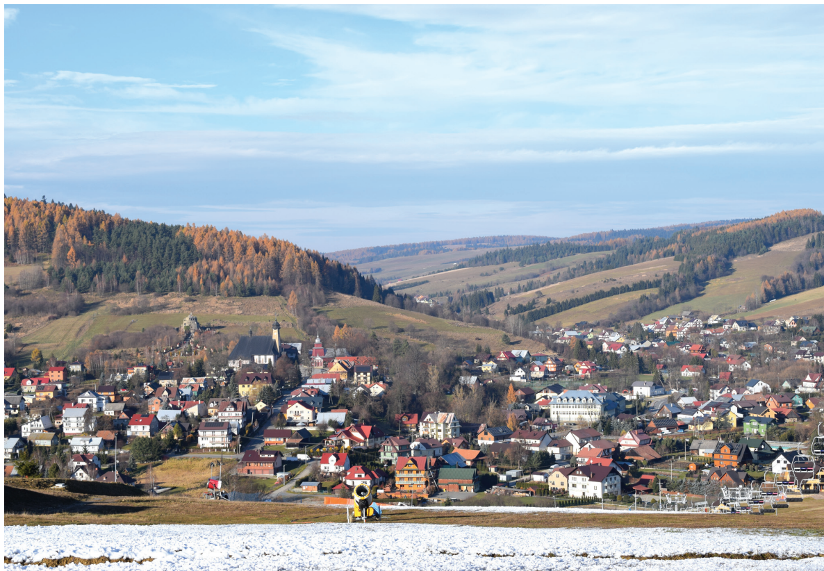
Panorama Tylicza, widok ze stacji narciarskiej