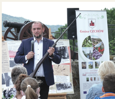
Prelekcja historyczna pn. „Wincenty Witos”