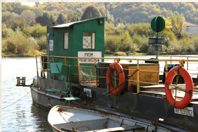
Prom na Dunajcu w Piaskach Drużków

Wieś należy do parafii czchowskiej. Wiernym służy kaplica zbudowana w 1983 r. i poświęcona w 1992 r., w której Msze święte odprawiane są w każdą niedzielę oraz święta. W kaplicy widnieje intronizowany obraz „Jezu ufam Tobie”, który po peregrynacji wśród mieszkańców wsi został umieszczony w kaplicy w 2015 r.