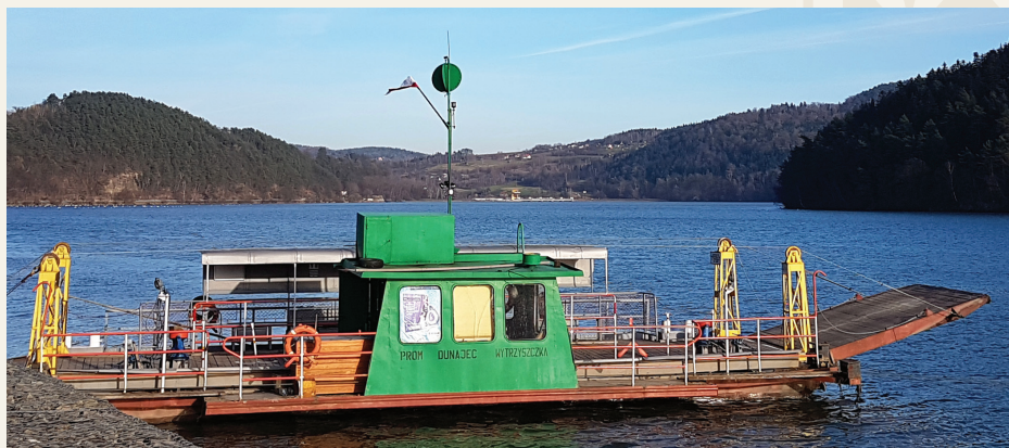
Prom w Wytrzyszczce do Tropia

Wytrzyszczka to najdalej na południe wysunięta miejscowość gminy Czchów, usytuowana nad lewym brzegiem Jeziora Czchowskiego, na wzniesieniu Głowaczka. Tuż przy granicy z ziemią sądecką po wschodniej stronie na cyplu znajduje się średniowieczny zamek zbójnicki Tropsztyn. Został on wzniesiony w XIII w. dla ochrony bramy sądeckiej. Kilkakrotnie zmieniał właściciela. W XVI w. opanowali go lokalni zbójcy doprowadzając do ruiny. Dopiero w latach 90. XX w. został odbudowany i dziś zamek jest udostępniany turystom w okresie letnim.