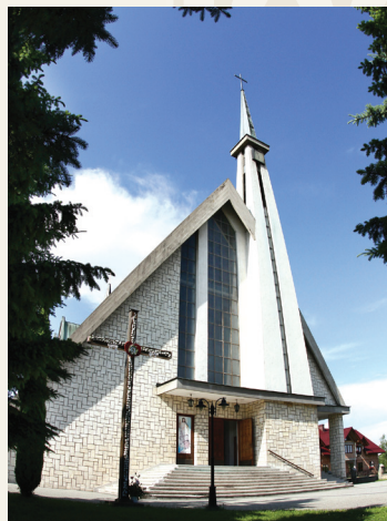
Kościół Miłosierdzia Bożego w Jurkowie