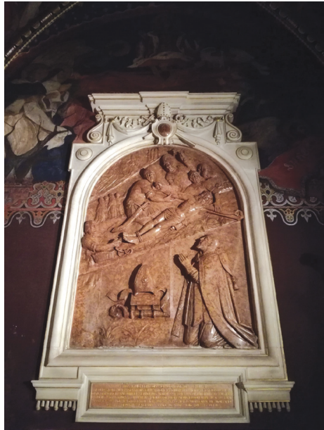
Tablica pamiątkowa z modlącym się bp. Piotrem Tylickim pochowanym w kaplicy Świętej Trójcy w Katedrze na Wawelu.