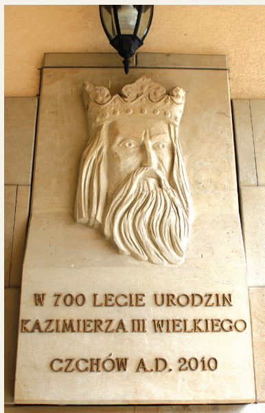
Tablica umieszczona przy wejściu do UM Czchowa poświęcona Kazimierzowi Wielkiemu z okazji 700-lecia jego urodzin