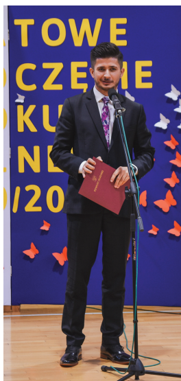
Bogumił Sobczyk – Starosta Olkuski