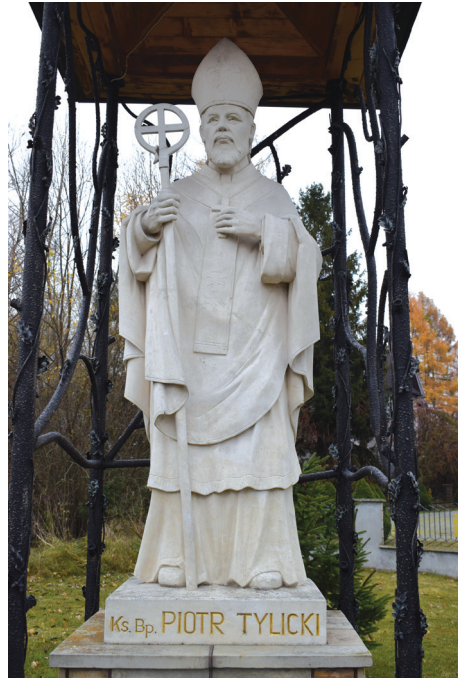
Pomnik bpa Piotra Tylickiego.

leusz 650-lecia lokacji. Uroczystości były obszernie opisane w „Zapiskach Kazimierzowskich”. Pamiątkami po Jubileuszowych Dniach są pomniki postaci zasłużonych dla Tylicza: króla Kazimierza III Wielkiego oraz biskupa Piotra Tylickiego. W dawnym ratuszu powstało Muzeum Dziejów Tylicza. Muzeum gromadzi liczne pamiątki związane z dziejami miejscowości w tym: kolekcje starych fotografii oraz kopie dokumentów. Najcenniejszą jest kopia Księgi Miasta Tylicza z 1633 r., w której prowadzone były zapisy do 1786 r.