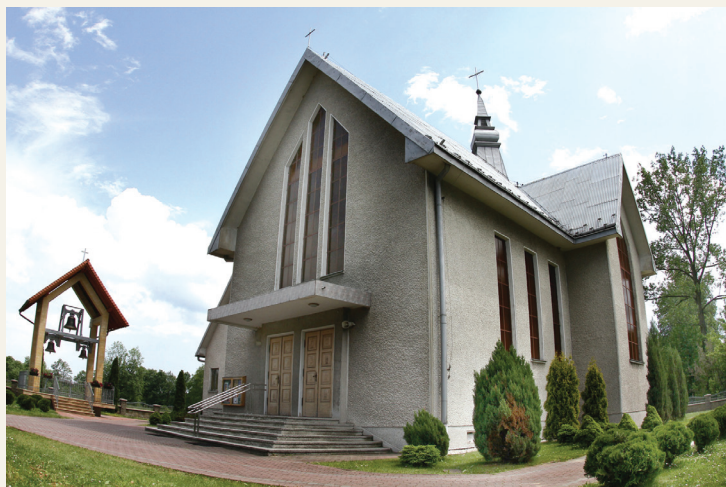
Kościół Matki Bożej Fatimskiej w Tworkowej