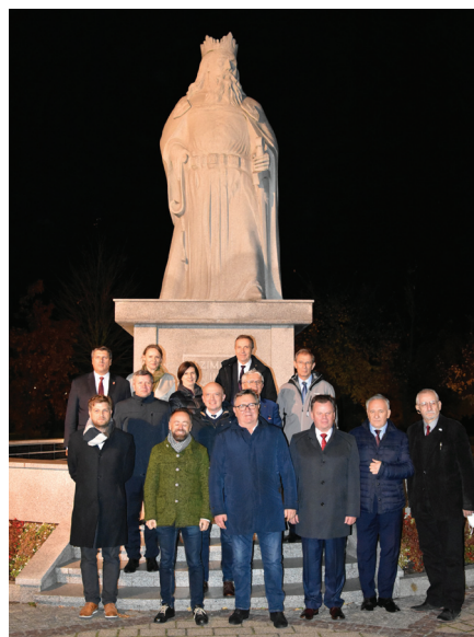
Uczestnicy obrad ogólnopolskich organizacji samorządowych przy pomniku króla Kazimierza Wielkiego.