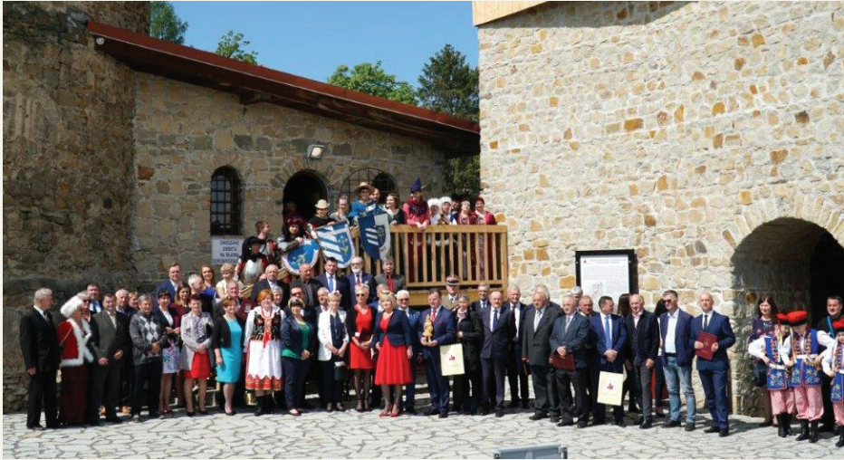
Władze samorządowe, pracownicy UM w Czchowie oraz członkowie organizacji pozarządowych na dziedzińcu zamkowym w Czchowie

Z prowadzonych statystyk wynika, że Zamek i Szlak Militarno-Historyczny w Czchowie wraz z miasteczkiem podczas sezonu turystycznego w 2019 r. odwiedziło około 20 tys. osób.