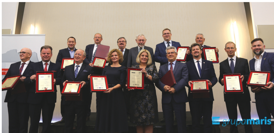
Laureaci X jubileuszowej edycji nagrody im. Norberta Barlickiego, Grupa Maris.