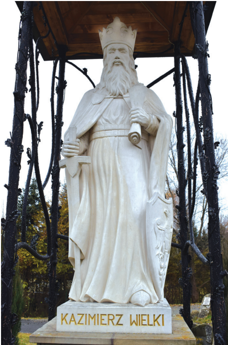
Pomnik Kazimierza Wielkiego.