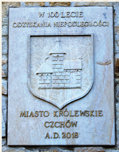
Tablica umieszczona na murach zamku w Czchowie poświęcona 100-rocznicy Odzyskania Niepodległości RP

prawa magdeburgskiego, w wypadkach wątpliwych mogą się odwołać do sądu prawa niemieckiego w Krakowie. Przed rokiem 1360 Czchów przeszedł w ręce królewskie. W tym bowiem roku Kazimierz Wielki przyznał prawo do połowy patronatu nad kościołem czchowskim dziedzicom wsi Ruda Kameralna, Domosławice, Filipowice i Drużków. Według Długosza Kazimierz Wielki otoczył miasto murami i miał tu odwiedzać swoje wybranki. Rozwojowi miasta sprzyjało położenie na szlaku handlowym z Węgier do Krakowa. Istniała tu komora celna. Dokumenty dotyczące poboru cła w komorze czchowskiej wydawali kolejni władcy, w tym w 1364 r. – Kazimierz Wielki, w 1378 r. – królowa Elżbieta Łokietkówna, w 1380 r. – Ludwik Węgierski, w 1405 r. – Władysław Jagiełło. Od czasów piastowskich w materiałach źródłowych znaleźć można wzmianki o istnieniu szpitala jako przytułku dla ubogich. Na wzgórzu w pobliżu miasta, ale już poza obrębem murów miejskich, znajdował się zamek, którego powstanie datowane jest na przełom XIII i XIV w. W źródłach z 1356 r. pojawia się Imram, syn Żegoty,