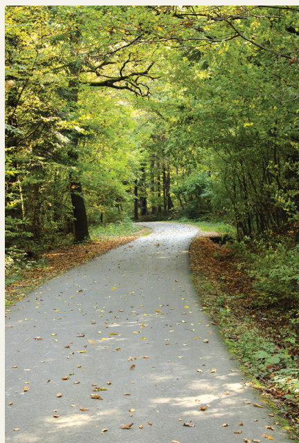
Leśnia droga w okolicach Będzieszyna