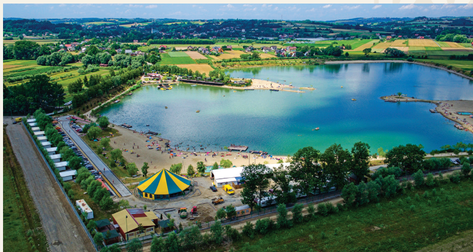
Kąpielisko „Chorwacja” w Jurkowie

Kąpielisko „Chorwacja” w Jurkowie jest dobrym miejscem do wypoczynku dla wszystkich, którzy lubią aktywnie spędzać czas. Oferuje piaszczyste i kamienne plaże z pomostami oraz wydzielone miejsca dla dzieci: płytkie zatoki i niskie baseny z fontannami. Bogaty asortyment sprzętu wodnego (rowery wodne, kajaki, łodzie, itp.) zapewnia świetną zabawę podczas wypoczynku w słoneczne, letnie dni. Kolejną atrakcją kąpieliska jest park linowy, z którym mogą zmierzyć się zarówno najmłodszy jak i do-