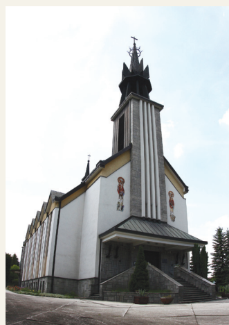
Kościół św. Michała Archanioła w Złotej