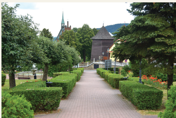
Fragment Rynku w Czchowie