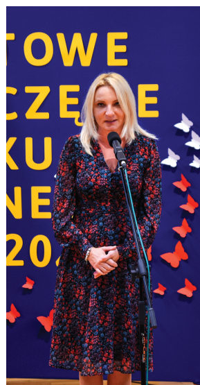
Agnieszka Ścigaj – Poseł na Sejm RP