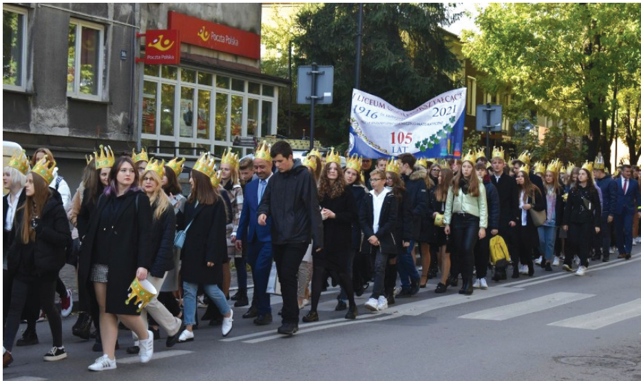
Uczniowie I LO podczas przemarszu ulicami Olkusza.