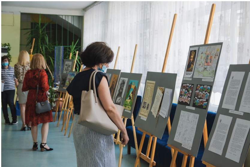
Prezentacja prac plastycznych

Wyniki konkursu znajdują się na stronie internetowej I LO: „Król Kazimierz Wielki i jego czasy” - wyniki konkursu - I Liceum Ogólnokształcące (lo1olkusz.eu)