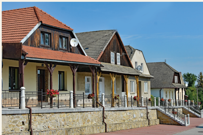
Podcienia domów w centrum Czchowa